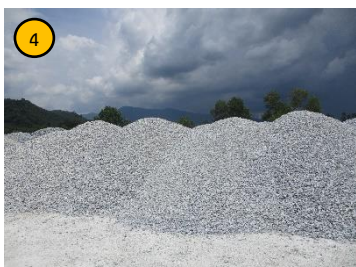
ลานเก็บกองแร่