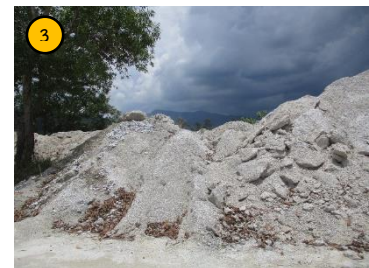
กองเปลือกดิน