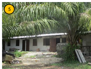
บ้านพักพนักงาน