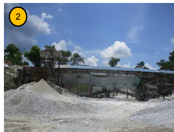
โรงแต่งแร่ของโครงการ