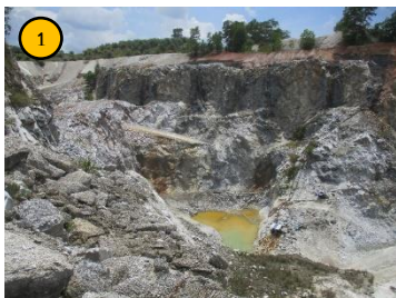
พื้นที่หน้าเหมือง