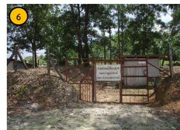
อาคารเก็บวัดถูระเบิด